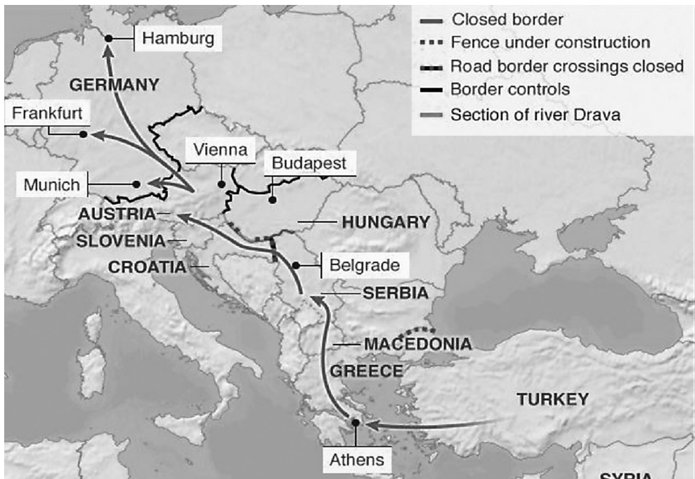
Mapa 1. Główna trasa migracyjna do Unii Europejskiej w 2015 r.