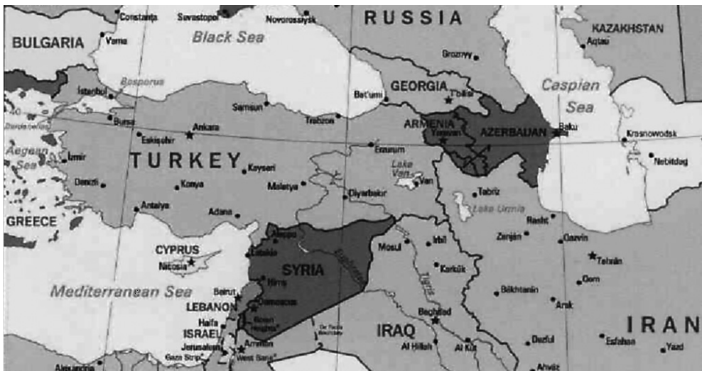
Mapa 1. Geopolityczne położenie Turcji

Tzw. historyczną głębię Republiki Turcji stanowi spuścizna Imperium Ottomańskiego. Jako jego spadkobierca Turcja jest odpowiedzialna za stabilizację i rozwój wydarzeń na obszarze postimperialnym, który rozciąga się od Maghrebu po Kaukaz i od Bałkanów po Ocean Indyjski (Balcer, 2010, s. 13). Czynniki sprzyjającymi kooperacji państw położonych na tak rozległej przestrzeni powinny być wspólna tradycja, historia, religia oraz kultura (Bocheńska, 2011). Tzw. geograficzna głębia warunkowana jest przez geo-